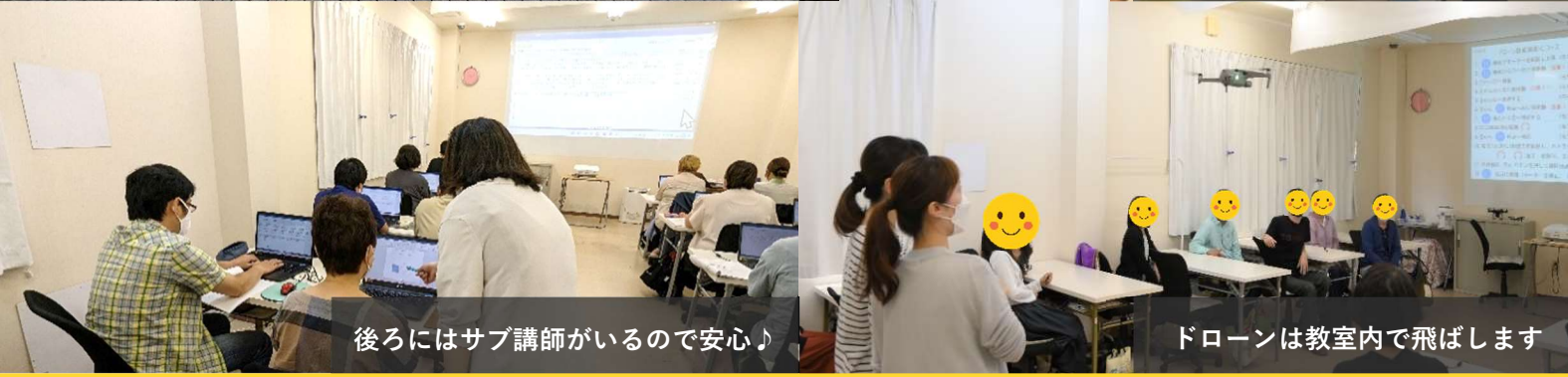
後ろにはサブ講師がいるので安心♪