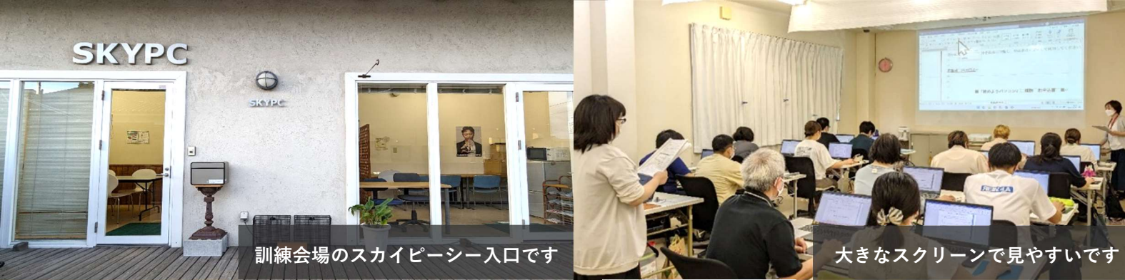
訓練会場のスカイピースー入口です