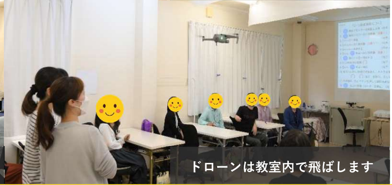
ドローンは教室内で飛ばします

パソコンはできるけど 独学だったので、 知らないこともたくさん あり、勉強になりました 20代女性