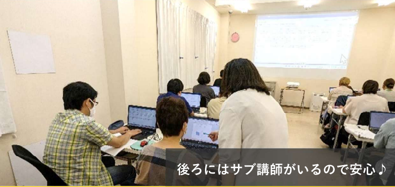
後ろにはサブ講師がいるので安心♪