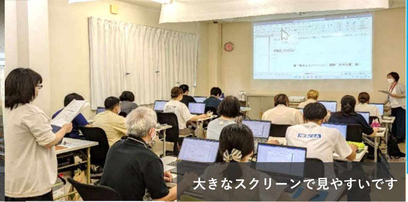
大きなスクリーンで見やすいです