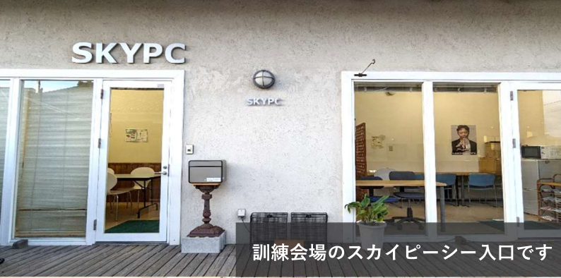
訓練会場のスカイピースー入口です